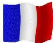
Lycée "La Hotoie" Amiens (France)