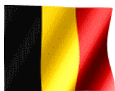
Institut "Don Bosco" Verviers (Belgique)